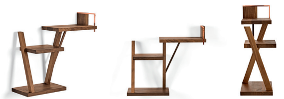
Taidgh Shelf C Walnuss, Kupfer walnut, copper