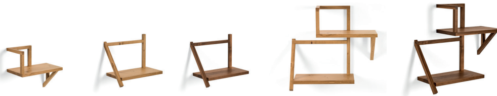
Taidgh Shelf A Eiche oak