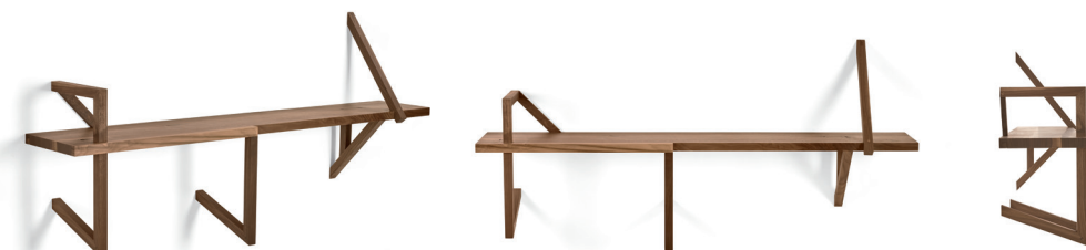
Taidgh Shelf D Walnuss walnut