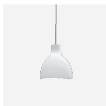
Toldbod Glas Pendelleuchte